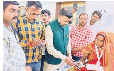
खुलासा फर्स्ट... इंदौर