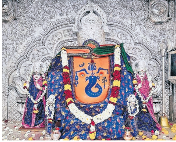
खजराना में भगवान गणेश का आज सुबह अभिषेक, पूजन कर आकर्षक शृंगार किया गया। भगवान को फूलों से सजाकर भोग लगाया गया।