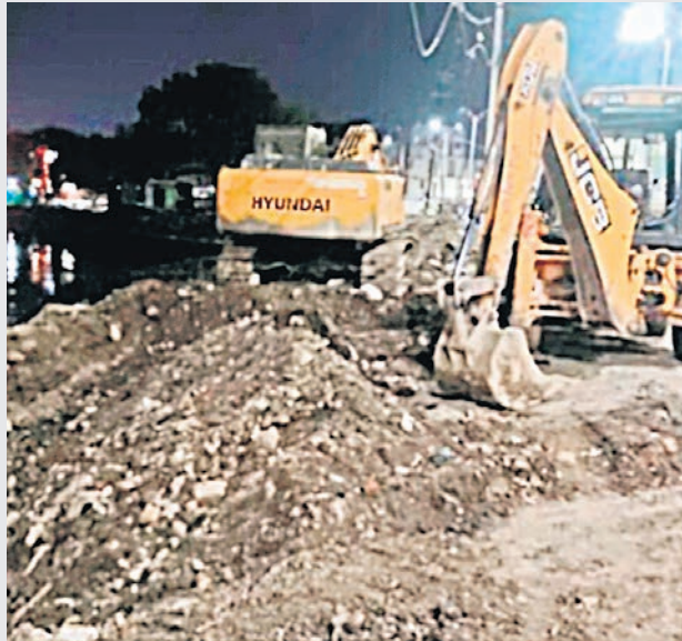
मच्छीबाजार क्षेत्र में नाला टैपिंग के पाइप डालने का कार्य हो रहा है।

मौके पर भीड़ बढ़ती देख निगम अफसर और पोकलेन चालक वहां से गायब हो गए। बाद में लोगों ने अन्य मजदूरों के साथ मिलकर मिट्टी हटाकर मजदूर को बाहर निकालने का कार्य शुरू किया। इस बीच दूसरी साइट पर काम कर रहा जेसीबी चालक आया और उसने पोकलेन से मिट्टी हटाई। भारी मशकत के बाद करीब आधे घंटे में मिट्टी मिट्टी में दबे मजदूर को निकाला जा सका। उसके बाद उसे अस्पताल लेकर गए लेकिन चिकित्सकों ने उसे मृत घोषित कर दिया। पुलिस ने शव को पोस्टमार्टम के लिए जिला अस्पताल भेज दिया।