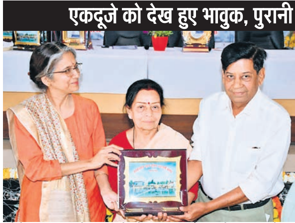
एकदूजे को देख हुए भावुक, पुरानी यादें ताजा कीं

मप्र और छत्तीसगढ़ के रिटायर पुलिस अफसर हाल ही में सागर में आयोजित एलुमिनाई में मिले। साथ में ट्रेनिंग और पढ़ाई करने वाले इन अफसरों ने न केवल जमकर मौज-मस्ती की, बल्कि पुलिस ट्रेनिंग के दौरान साथ बिताया शानदार समय भी याद किया। करीब पांच दशक पहले बिछड़े ये अफसर बरसों बाद मिले। 28 फरवरी से 2 मार्च तक हुए तीन दिनी कार्यक्रम में सपत्निक पहुंचे अफसरों ने जमकर मस्ती की