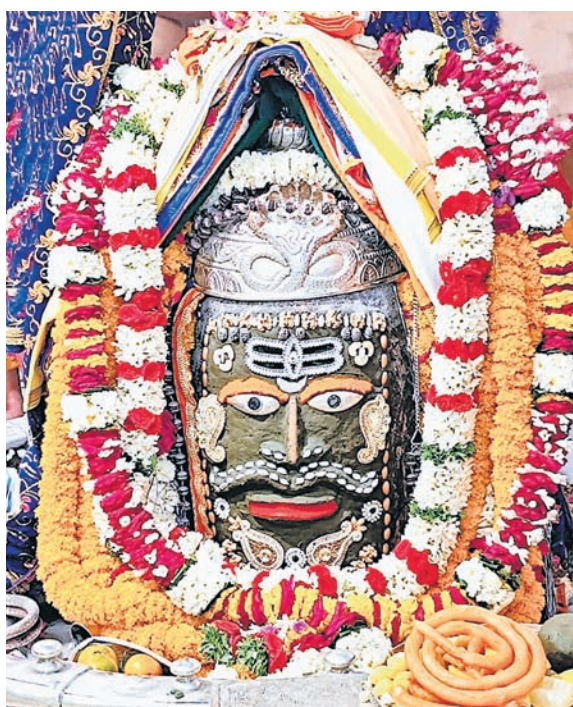
भस्मारती के दौरान आज सुबह भगवान महाकाल का भांग, सूखे मेवों और फूलों से आकर्षक शृंगार कर भोग अर्पित किया गया।