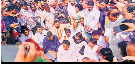
कमलनाथ पीड़ित परिवार से मिलने पहुंचे

फिर इस वर्ष 4 जनवरी को मालवा के आदिवासी शहीद टंट्या मामा की जयंती भी मनाई। इंदौर से जन्मस्थली कालाकुंड तक यात्रा भी निकाली। इसके अलावा, आदिवासियों को भू-अधिकार पट्टे देने का कानून भी बनाया। सब जानते हैं कि प्रदेश में सत्ता मालवा-निमाड की वजह से मिलती है, इसलिए यहां मुख्यमंत्री ने सबसे ज्यादा आदिवासियों को सहेजने की कोशिश की, लेकिन दो दिन पूर्व महु के डोंगरगांव की घटना ने मुख्यमंत्री की इन कोशिशों को पलीता लगा दिया है।