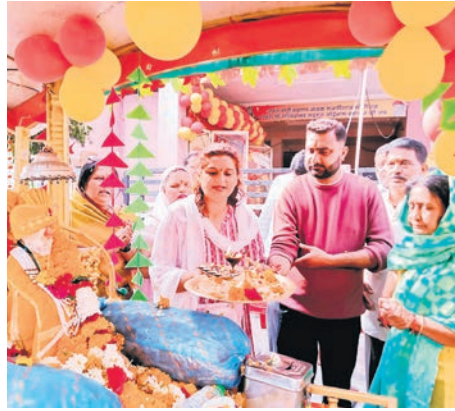
खुलासा फर्स्ट... इंदौर