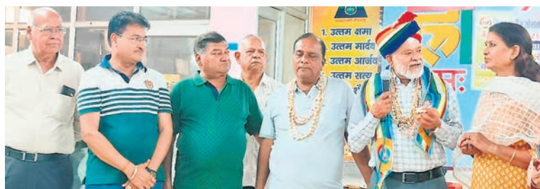
खुलासा फर्स्ट... इंदौर