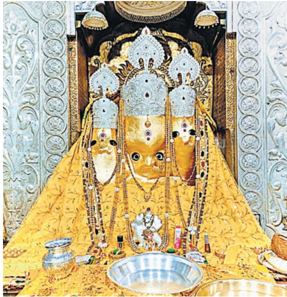
नलखेड़ा स्थित बगलामुखी माता का आज सुबह पूजन कर आकर्षक शृंगार किया गया। आरती कर मां को प्रसाद का भोग लगाया गया।